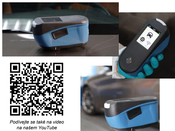
Podívejte se také na video na našem YouTube

Více informací o programu se dočtete také na našich webových stránkách www.autofit.cz .