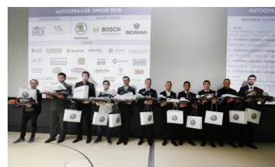
Výběr fotografií z vyhlášení vítězů 24. ročníku celostátní soutěže Autoopravář junior 2018